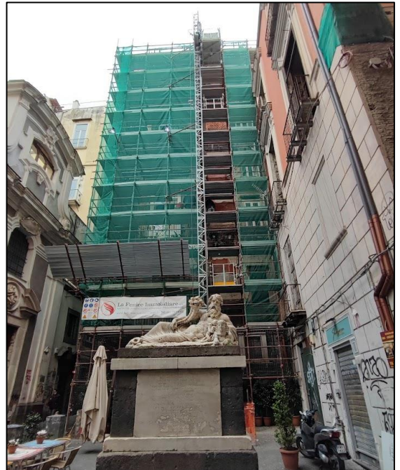
Restauro della facciata monumentale su Largo Corpo di Napoli del "Palazzo Beccadelli detto il Panormita".