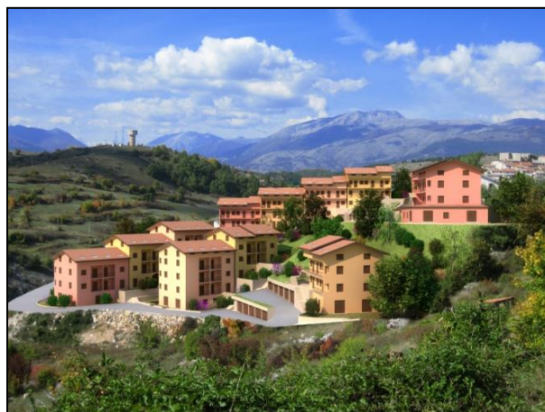
Lavori di realizzazione del Complesso Residenziale "Parco dell'Orso" e relative urbanizzazioni, per complessivi n.89 appartamenti – 1 lotto - Rionero Sannitico (Is).