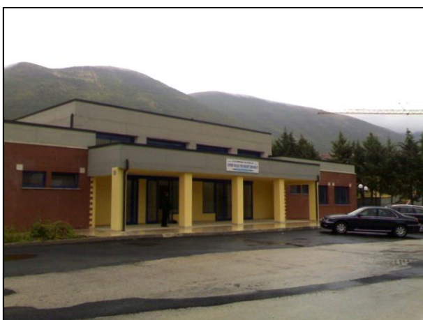
Lavori per la realizzazione di un centro sociale polifunzionale - Comune di Polla (SA) – Prospetto principale.