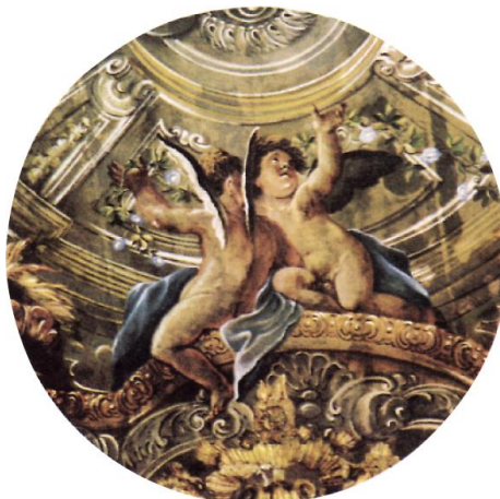
particolare di affresco - Chiesa Madre S. Maria delle Grazie - Quindici (Av)