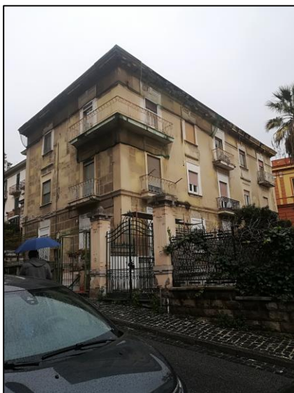
Fabbricato in Napoli al Viale Maria Cristina di Savoia n. 6 – prima dell'intervento di restauro.