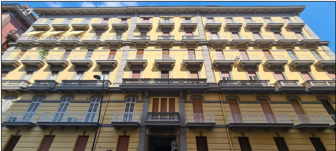
Fabbricato in Napoli alla Via Fiorelli n. 12–dopo l'intervento di restauro.