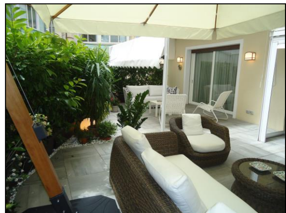
Particolare di un terrazzo a livello