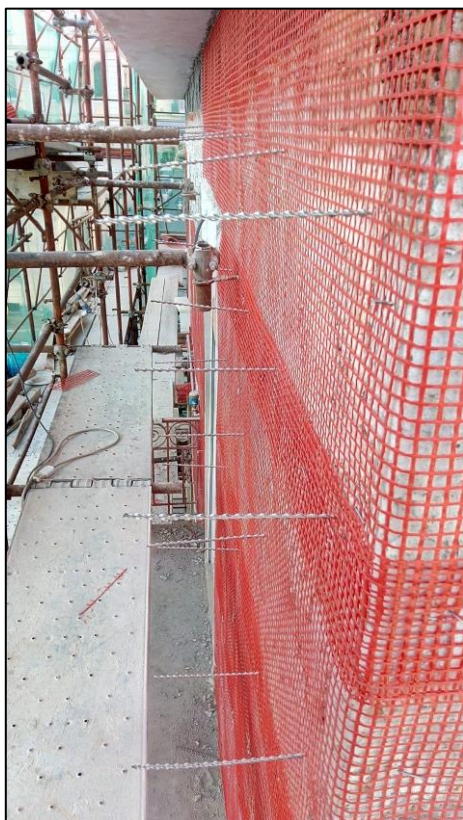
Particolare di intervento di consolidamento statico su murature in tufo, per antibaltamento dei paramenti murari, mediante applicazione di rete in fibra di vetro OLYMPUS e trefoli in acciaio inox.