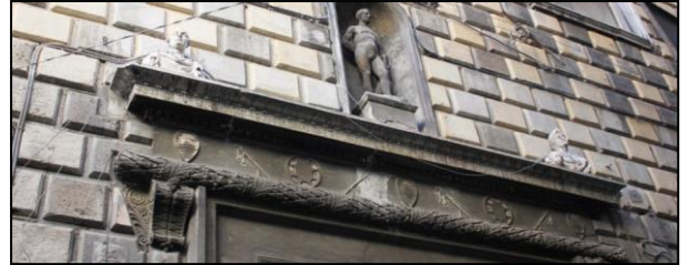
Palazzo Diomedea Carafa di Maddaloni - Santangelo (XV sec.) - Napoli - Particolare del bugnato policromo- dopo l'intervento di restauro.