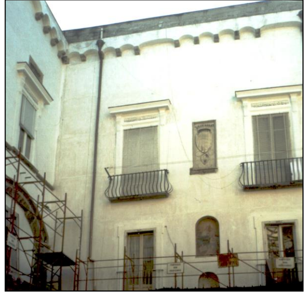
Palazzo Diomedea Carafa di Maddaloni - Santangelo (XV sec.) - Napoli - Facciata Nord della corte interna dopo l'intervento di restauro.