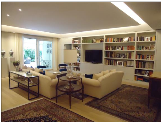
Particolare di un soggiorno living.