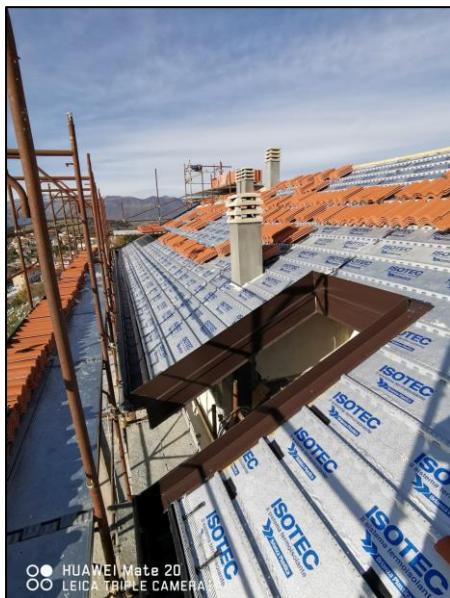
Particolare di intervento di isolamento termico di una copertura a falde con pannelli ISOTEC.

RESTAURI - COSTRUZIONI GENERALI - PROGETTAZIONE