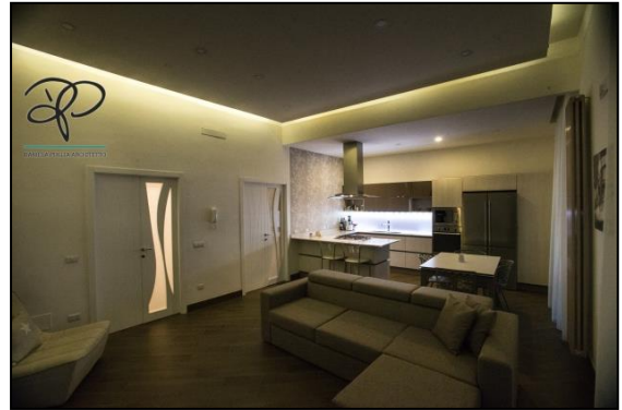
Particolare del salone di un appartamento realizzato nel quartiere nobile di Chiaia a Napoli.

In linea con il progressivo e costante aggiornamento delle tecnologie nel settore, è ormai di routine l’installazione di sistemi di miglioramento delle performances energetiche sia attraverso l’efficientamento delle strutture che attraverso l’installazione di sistemi domotici all’avanguardia.