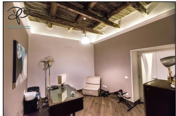
Particolare di un graticciato ligneo a vista.