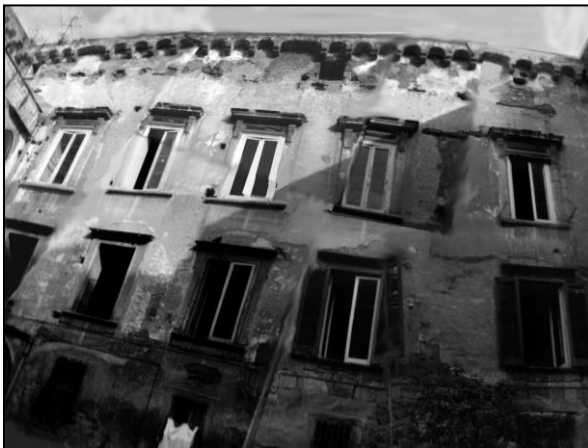
Palazzo Diomedea Carafa di Maddaloni - Santangelo (XV sec.) - Napoli - Facciata Ovest della corte interna prima dell'intervento di restauro.