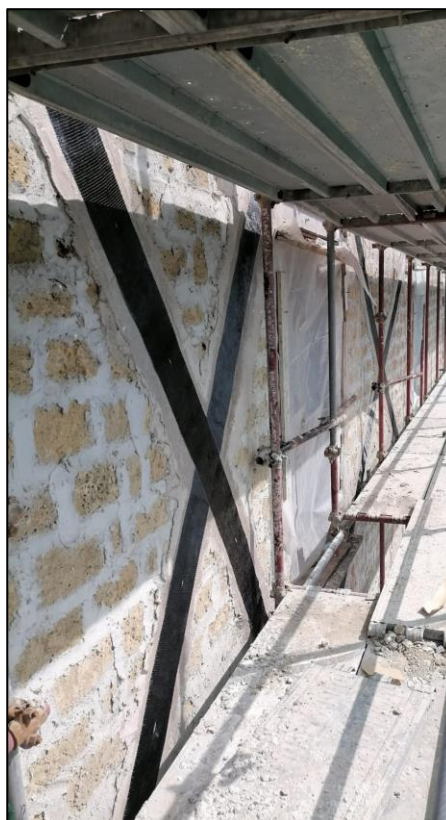
Particolare di intervento di consolidamento statico su murature in tufo, per antibaltamento dei paramenti murari, mediante applicazione di fasce in fibre di carbonio OLYMPUS posate a "croce di sant'Andrea".