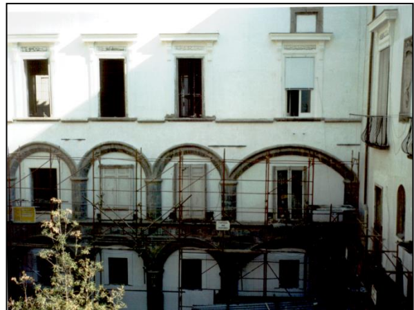
Palazzo Diomedea Carafa di Maddaloni - Santangelo (XV sec.) - Napoli - Facciata Ovest della corte interna dopo l'intervento di restauro.