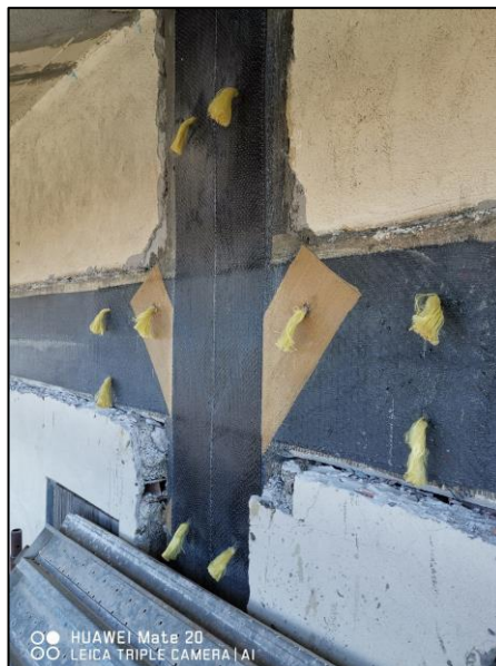
Particolare di intervento di confinamento nodo trave-pilastro con fibre di carbonio e aramide OLYMPUS, con applicazione di fiocchi in aramide su struttura in cemento armato.