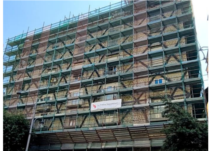
Intervento di consolidamento statico su fabbricato in tufo, per antibaltamento dei paramenti murari mediante applicazione di fasce in fibre di carbonio posate a "croce di sant'Andrea".