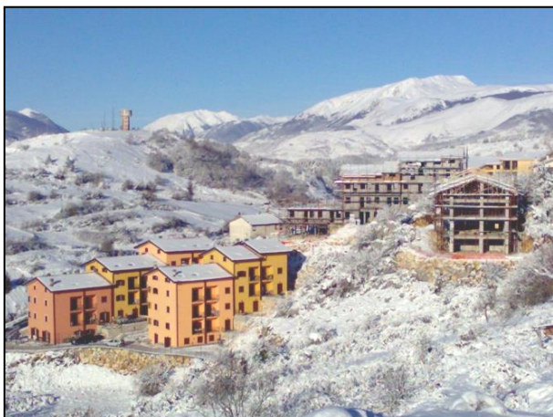
Lavori di realizzazione del Complesso Residenziale "Parco dell'Orso" e relative urbanizzazioni, per complessivi n.89 appartamenti – 1 lotto - Rionero Sannitico (Is).

RESTAURI - COSTRUZIONI GENERALI - PROGETTAZIONE