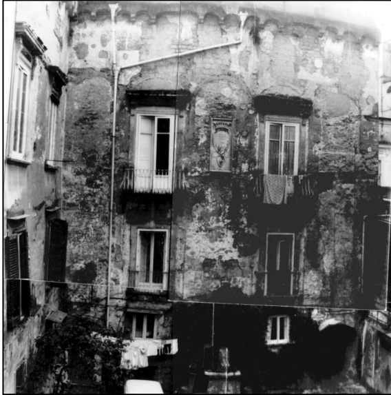
Palazzo Diomedea Carafa di Maddaloni - Santangelo (XV sec.) - Napoli - Facciata Nord della corte interna prima dell'intervento di restauro.

RESTAURI - COSTRUZIONI GENERALI - PROGETTAZIONE