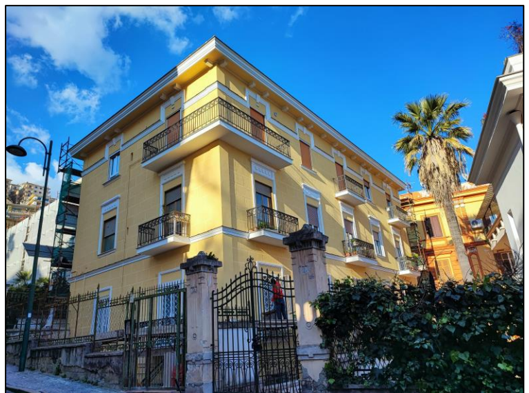
Fabbricato in Napoli al Viale Maria Cristina di Savoia n. 6 –dopo l'intervento di restauro.